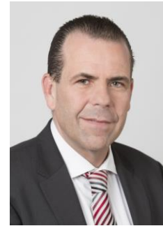
Harald Vilimsky FPÖ