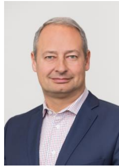
Andreas Schieder SPÖ