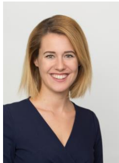
Claudia Gamon NEOS