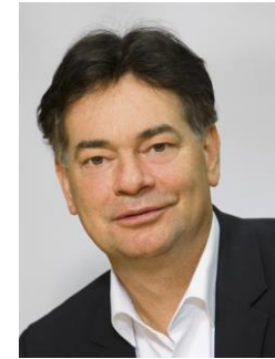
Werner Kogler Grüne