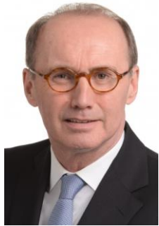
Othmar Karas ÖVP