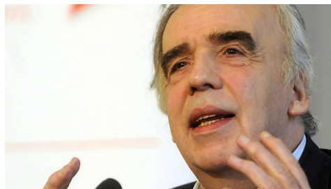
Johannes Voggenhuber JETZT